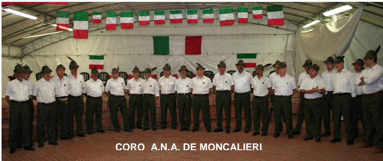
CORO A.N.A. DE MONCALIERI

A ser posible, se deberá llevar el vestuario de la Asociación.